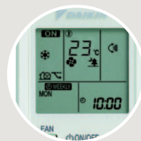
Infrarood-afstandsbediening (standaard) ARC452A1